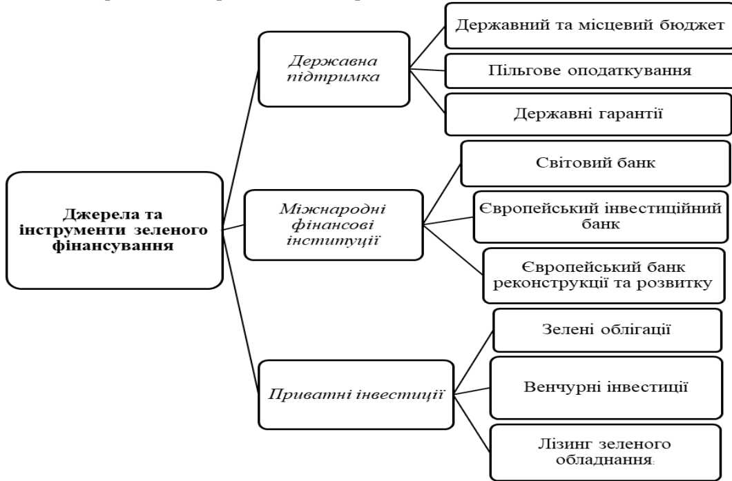
Рис. 2. Основні інструменти зеленого фінансування в Україні

гоефективність. Новими перспективними напрямками є розвиток зеленого водню, електромобільності, «зеленого» будівництва. На перспективу очікується, що зелені інвестиції відіграватимуть важливу роль у відновленні та модернізації економіки України після війни.