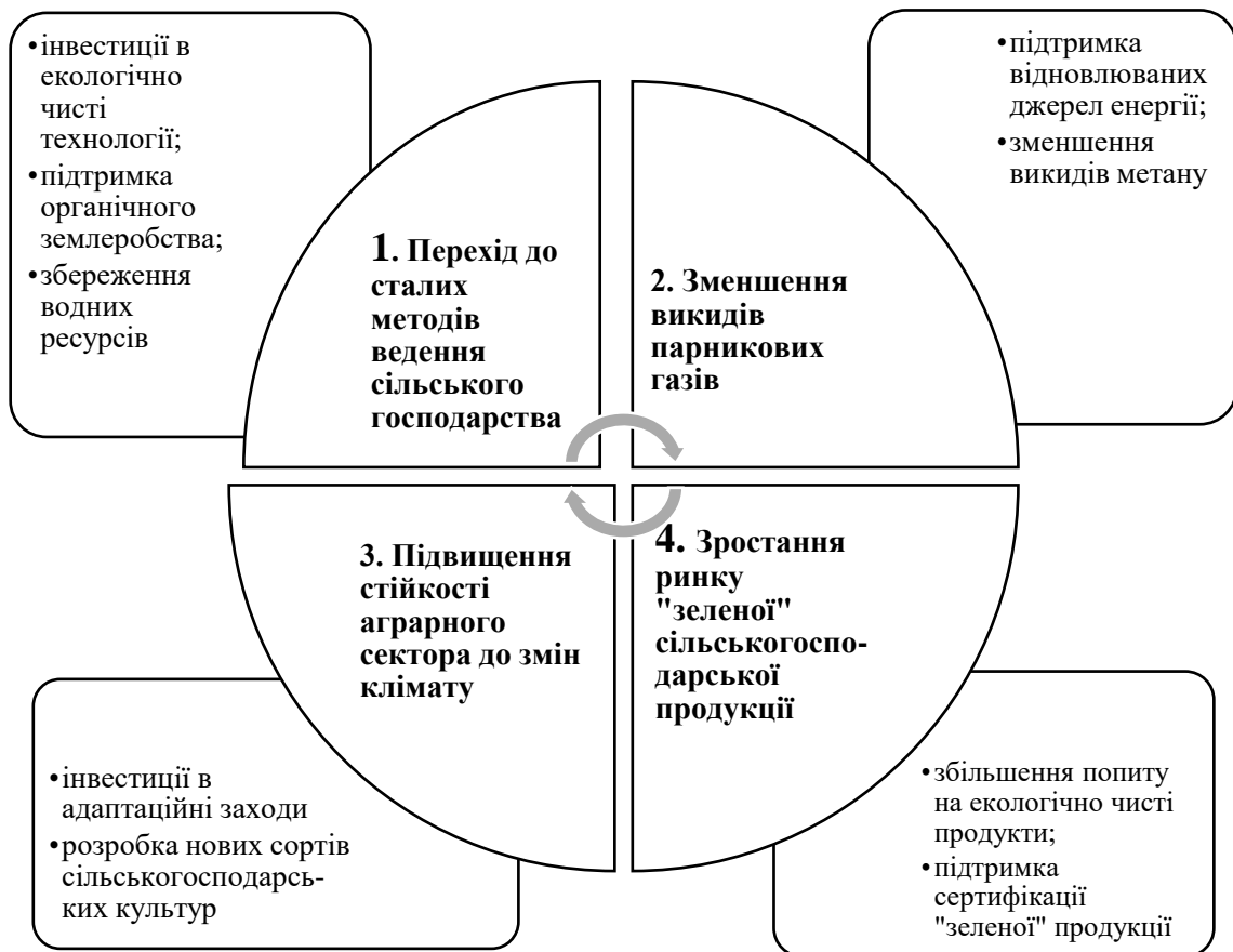
Рис. 3. Зв'язок зеленого фінансування із сільським господарством