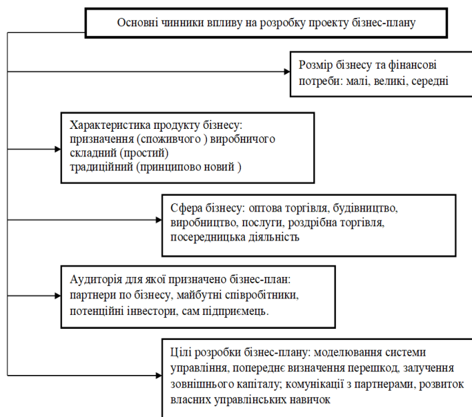
Рис. 2. Чинники, що впливають на зміст і структуру бізнес-плану

Зміст бізнес-планів різних видів також визначається особливостями, властивими тому чи іншому бізнесу (рис. 2). До основних завдань розробника бізнес-плану під керівництвом лідера належать: визначення кількості напрямів бізнесу; планування джерел фінансування (отримання зовнішнього фінансування, необхідного для реалізації бізнес-проекту); обґрунтування характеристик продукту. На початковому етапі підприємницького проекту бізнес-план є основним засобом комунікації між підприємцем та майбутніми постачальниками, продавцями та працівниками. Отже, успіх його реалізації залежить від особистих управлінських якостей підприємця (лідера).