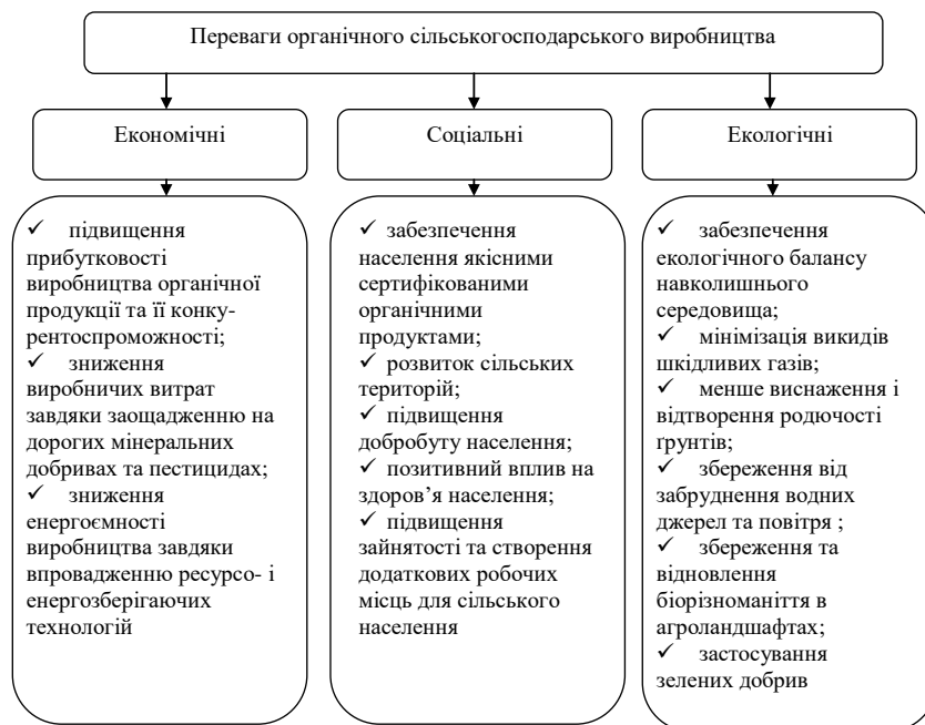
Рис. 1. Переваги органічного сільськогосподарського виробництва в Україні* *Власні опрацювання автора

Органічне виробництво в Україні з кожним роком зростає, на що вказує аналіз динаміки показників кількості виробників органічної продукції та площі сільськогосподарських земель, зайнятих під органічним виробництвом (рис. 2).