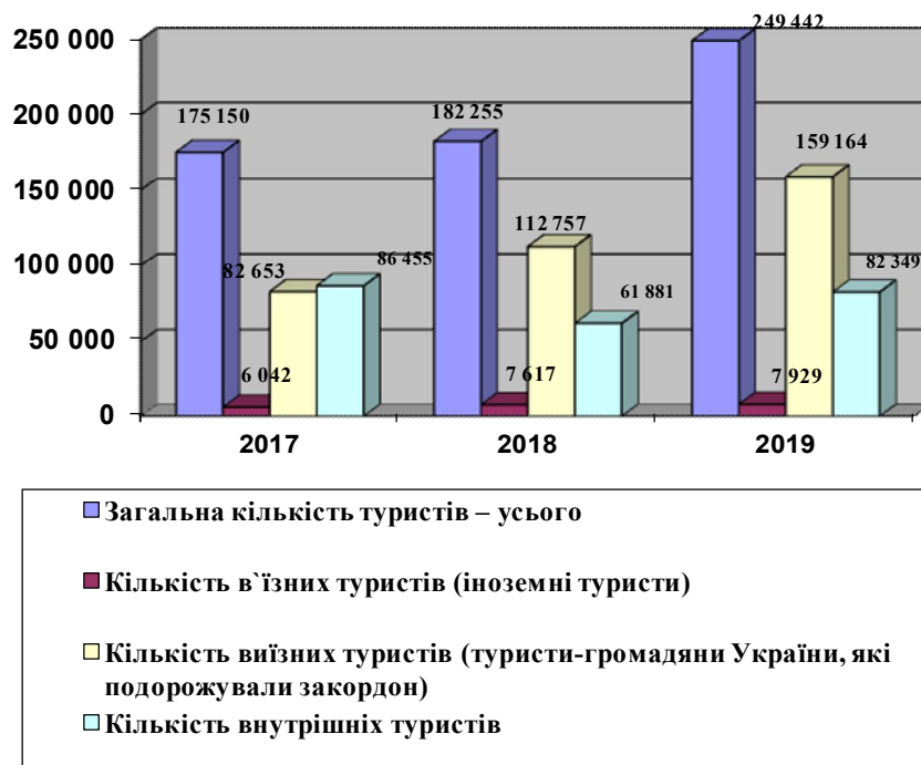
Рис. 1. Динаміка кількості туристів та екскурсантів, яких обслуговували суб'єкти туристичної діяльності Львівської області, осіб* *Джерело: (Статистичний щорічник Львівської області за 2019 рік, 2020, ч. 1; Статистичний щорічник Львівської області за 2019 рік, 2020, ч. 2).

Аналізуючи структуру туристичного потоку Львівської області у 2019 році, можемо зауважити, що найбільшу питому вагу мали виїзні туристи (громадяни України, які подорожували за кордон), далі йдуть внутрішні та в'їзні туристи (іноземні туристи) (рис. 2). Виїзних туристів більше, тому що туристичні подорожі громадян України переважно зумовлені бажанням людей відпочити та оздоровитися під час відпусток у країнах зі сприятливими кліматичними умовами.