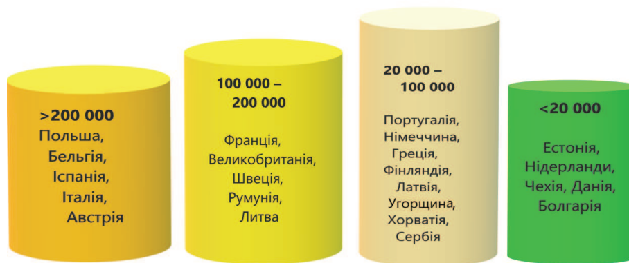
Рис. 1. Загальна кількість учасників країн-членів ЄС, які пройшли навчання у рамках зони фокусування «Сприяння навчанню упродовж всього життя та професійна освіта» за програмою «Передача знань» країн ЄС (ENRD. Rural Development Programmers 2014–2020: Focus Area 1C..., 2020).*

* Градація проведена відповідно до загальної кількості учасників.